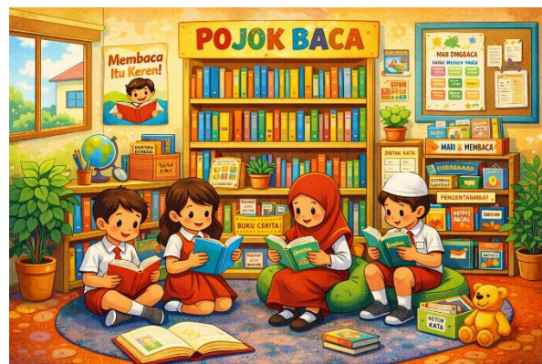
Gambar 1. Ilustrasi Pojok Baca

Pojok baca menawarkan konsep yang lebih dinamis dibandingkan perpustakaan konvensional yang bersifat sentralistik. Dengan memanfaatkan area strategis seperti sudut kelas atau selasar sekolah, pojok baca menciptakan aksesibilitas literasi yang lebih tinggi bagi siswa (Anugrah et al., 2022). Integrasi pojok baca dalam lingkungan belajar bertujuan untuk membangun atmosfer yang inklusif dan memotivasi, guna merangsang minat baca siswa secara organik. Pembangunan fasilitas ini di SDN 3 Jatimulya diharapkan menjadi model percontohan bagi institusi pendidikan lain yang memiliki keterbatasan ruang namun tetap ingin memperkuat budaya literasi.